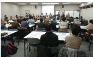
多くの方に参加いただきました

仙山線各駅のキーパーソンによる過去・現在・未来の座談会。仙山線への思いを残そうワークショップ。大回り乗車で人々の息吹に熱い思いやり(高専生)。雪・風・雨で絶対列車を止めなかった(大正生まれの国鉄員)。通勤、通学、列車の旅、苦しい・懐かしい思い出、みんなで語りあいました。仙山線の歴史、風土、文化を互いに理解して豊かな沿線の連携、次代へ継続できればと思います。