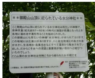
建て替えられた看板