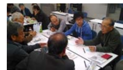
ワークショップで、みんなで語りあいました