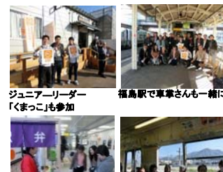
ジュニアリーダー