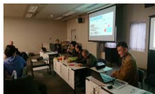
過去・現在・未来の座談会