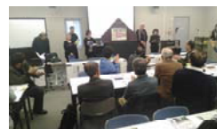
劇団ひろせによる紙芝居上映「鉄太の仙山線物語」