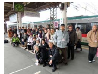
西北東北ローカル線の旅は小牛田駅ホームで記念撮影