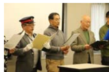
渥声合唱団 音里道の皆さんによるオープニング：仙山線囃歌