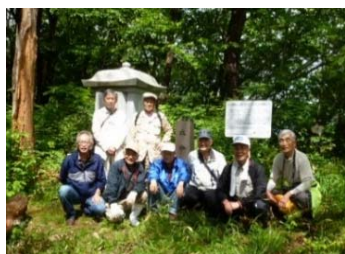
御殿山・水分(みくまり)神社前で記念撮影